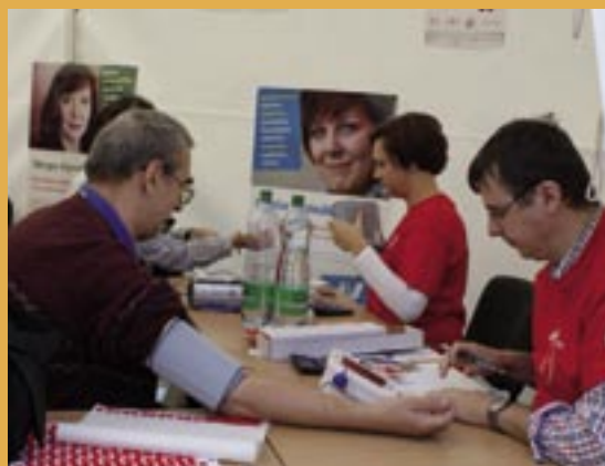
Svetový deň srdca v Bratislave.