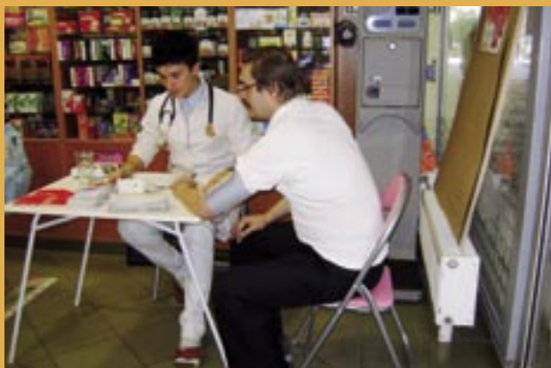
Svetový deň srdca vo lekárnach.

Zoznam zapojených lekární je uvedený v prehľadnej tabuľke. (str. 91)