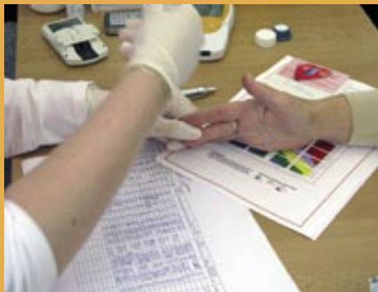
Svetový deň srdca v Bardejove.