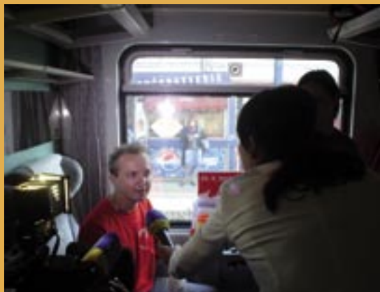
Merania vo vlakoch zdravého života.