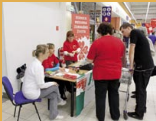
Svetový deň srdca v Leviciach.