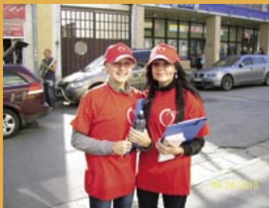
Svetový deň srdca v Nových Zámkoch.