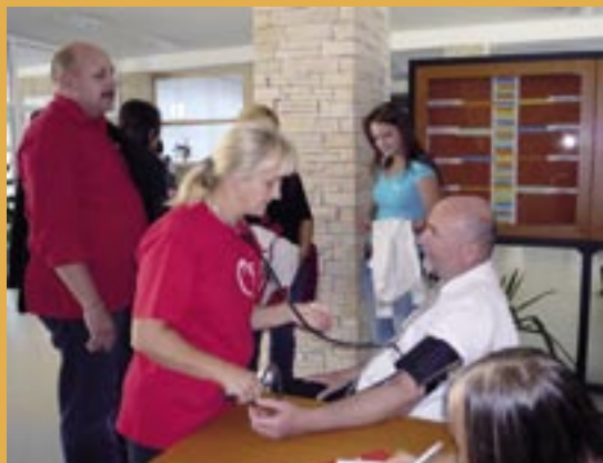
Svetový deň srdca vo Zvolene.