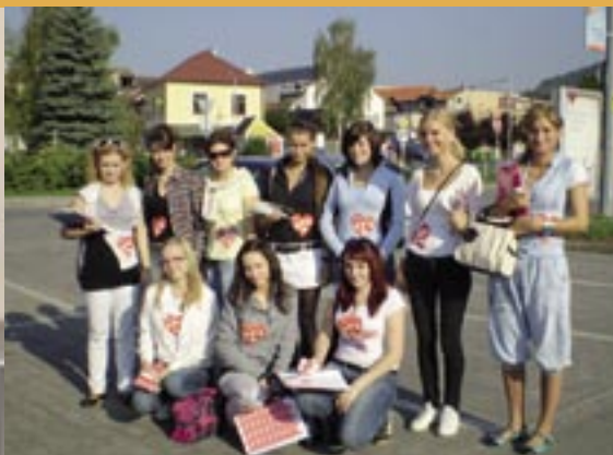
Svetový deň srdca v Rimavskej Sobote a Rožňave.