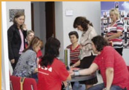
Svetový deň srdca v Čadci.