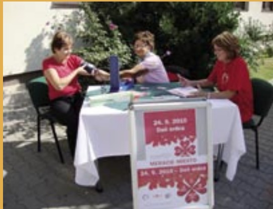
Svetový deň srdca v Nitre.

aj kupóny so zľavou na jazykové kurzy, ktoré Akadémia vzdelávania realizuje. Celkovo sa meraní na hlavnom stanovišti aktívne zúčastnilo 113 záujemcov. Celú akciu „Dňa srdca“ – MOST 2010 môžeme zhodnotiť ako veľmi úspešnú po organizačnej stránke, ako aj po stránke záujmu širokej verejnosti.“