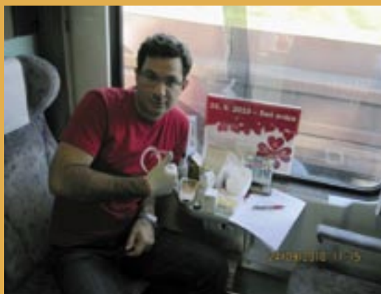
Merania vo Vlakoch zdravého života.