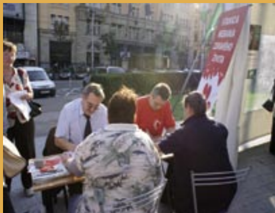
Svetový deň srdca v Bratislave.