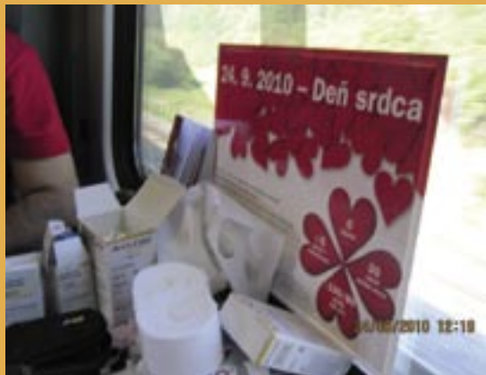
Merania vo Vlakovch zdravého života.