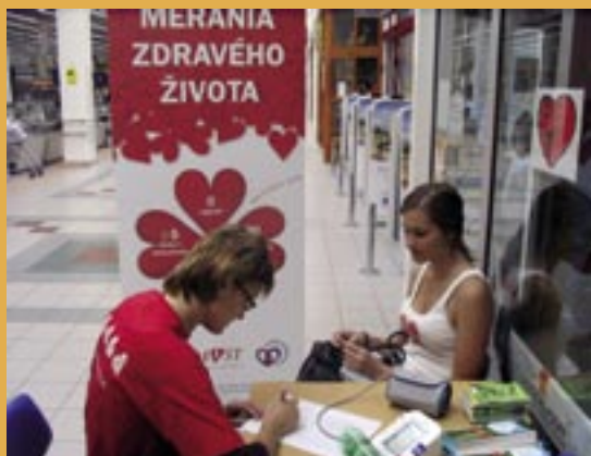
Svetový deň srdca v Prievidzi.