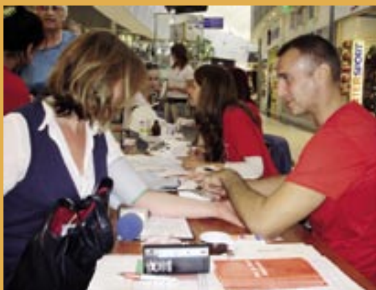
Svetový deň srdca v Košiciach.