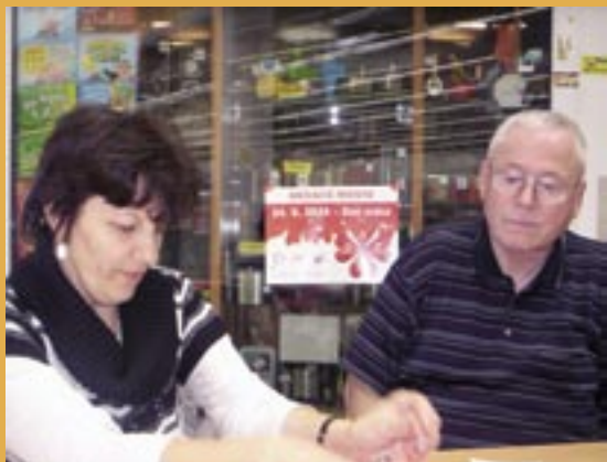
Svetový deň srdca v Martine.