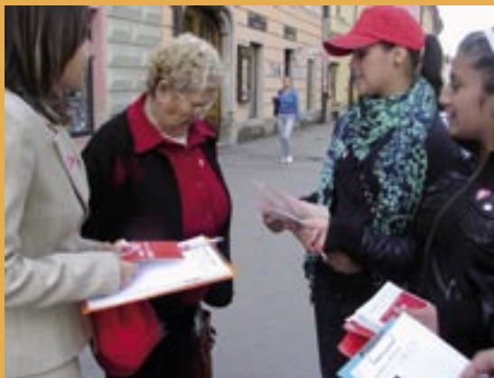
Svetový deň srdca v Spišskej Novej Vsi.