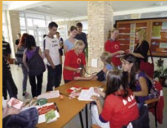
Svetový deň srdca vo Zvolene.