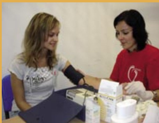
Svetový deň srdca v Humennom.