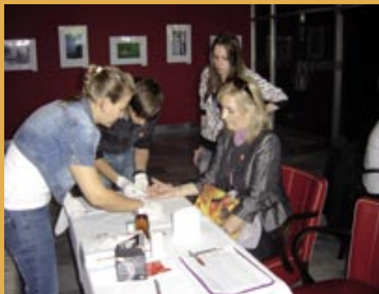
Svetový deň srdca v Dunajskej Strede.