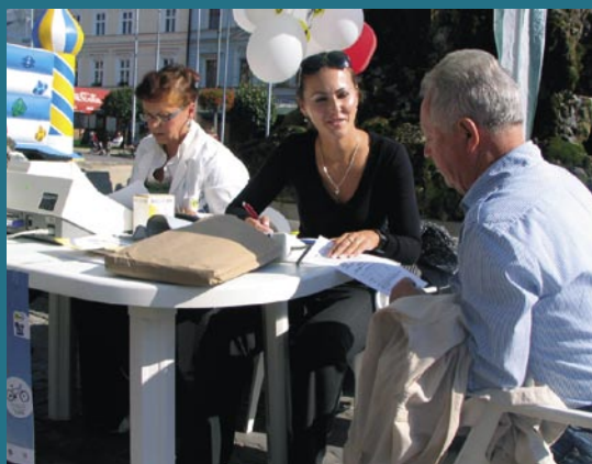
Beh o srdce v Banskej Bystrici na Námestí SNP.