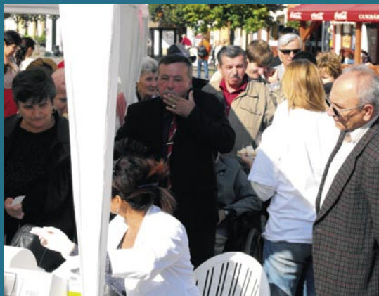
Beh o srdce v Košiciach na Hlavnej ulici.