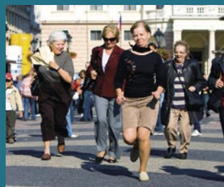
Beh o srdce v Bratislave na Hviezdoslavovom námestí.