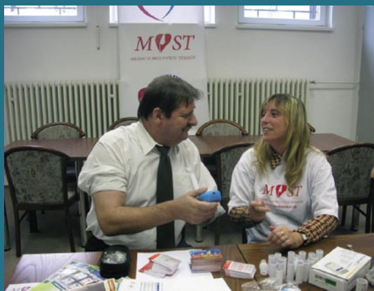
Osveta o srdci v Akadémii vzdelávania.