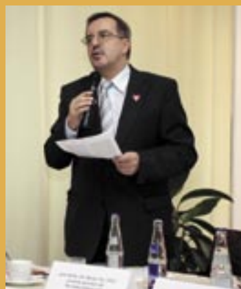
Účastníci tlačovej konferencie pri príležitosti spustenia kampane MOST.