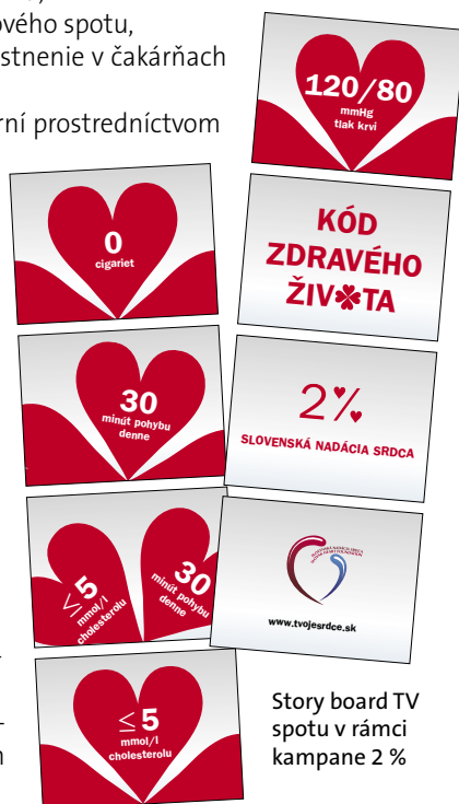
Story board TV spotu v rámci kampane 2 %

V rámci kampane okrem vyššie spomínaných aktivít prebehla aj mediálna kampaň. Bolo odvysielaných 50 televíznych spotov na STV, 20 čítaných oznamov v Slovenskom rozhlas, bolo uverejnených