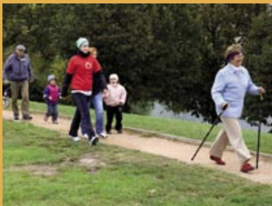
Kardiobeh a Kardiokrok – účastníci.