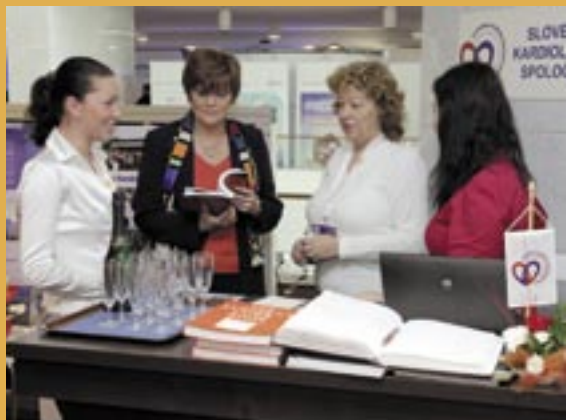
XV. Kongres SKS.

Slovenského národného divadla sa stretlo takmer 1500 lekárov z celého sveta na najväčšom medicínskom podujatí na Slovensku – na XV. Kongrese Slovenskej kardiologickej spoločnosti. Počas troch kongresových dní odznelo 172 prednášok a bolo prezentovaných 33 posterov z rôznych oblastí experimentálnej a klinickej kardiológie. Slovenská nadácia srdca sa na kongrese prezentovala tradičným stánkom. Účastníkom kongresu poskytla edukačné materiály a iné propagačné drobnosti. Rozdalo sa viac ako 600 publikácií „ Kardiovaskulárne ochorenia – najväčšia hrozba. Biela kniha “ a viac ako 400 publikácií MOST 2009. Živo sa diskutovalo o aktivitách a projektoch nadácie. V rámci odborného programu mala nadácia sekciu pod názvom Národný program prevencie ochorení srdca a ciev v kontexte Slovenskej nadácie srdca, kde okrem iného boli vyhodnotené aktivity Dňa srdca 24. 9. 2010 a NPPOSC.