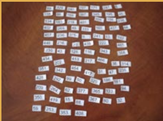
Zlosovanie o ceny pre študentov a pedagógov partnerských škôl.