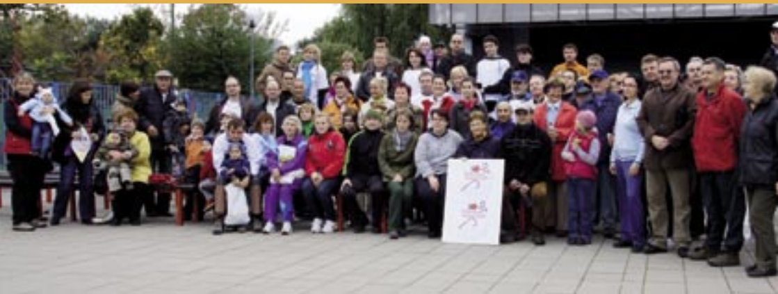
Kardiobeh a Kardiokrok – účastníci a víťazi.