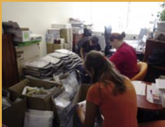
Balenie materiálov pre partnerov.