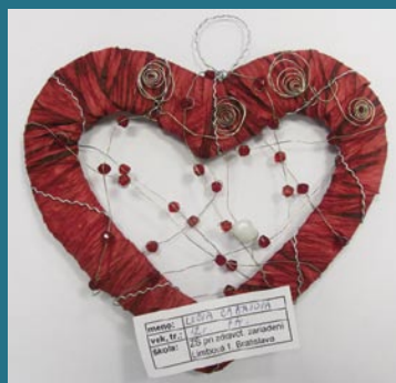
3. miesto – Lucia Cabajová