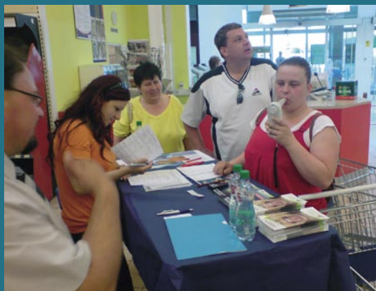
Pfizer Luxembourg SARL, o.z.