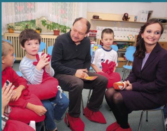
Daniel Hevier číta rozprávku škôlkarom.

Naše podujatie prišli podporiť aj Gombík & Gombička , ktoré si pre deti pripravili veselé vystúpenie plné prekvapení.