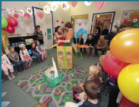
Gombík & Gombička.

program podpory zdravého spôsobu života, ktorý realizujeme na materskej škole. Srdečná vďaka.“