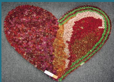
2. miesto – deti z ortopedického oddelenia