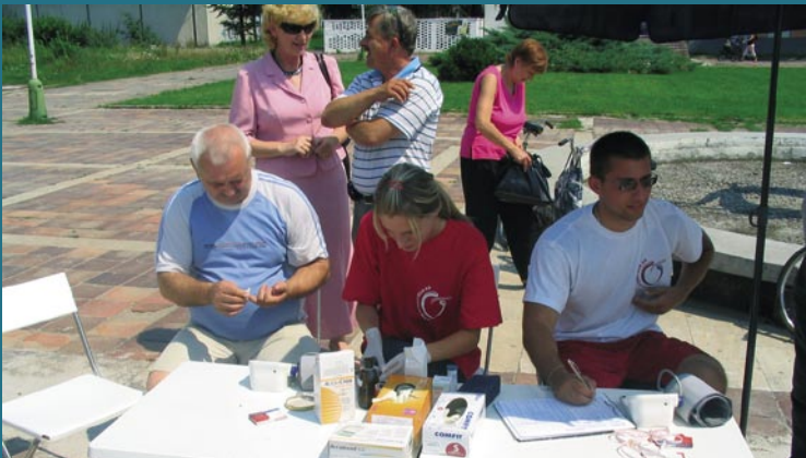
Vyšetrenia hladín cholesterolu boli realizované vďaka firme Astrazeneca.

Partner projektu AstraZeneca tento rok významne prispel k realizácii aktivít projektu MOST 2008 formou poskytnutia dvoch prístrojov na meranie hladiny cholesterolu a ich príslušenstva. Vďaka tejto významnej pomoci sme počas oboch projektov MOST a Lekári idú do ulíc boli schopní uspokojiť potreby meraní tohto z hľadiska rizika veľmi dôležitého kardiovaskulárneho ukazovateľa, o ktorý, ako sa ukázalo, bol mimoriadny záujem pri všetkých realizovaných meraniach. Za cennú pomoc patrí spoločnosti AstraZeneca úprimné poďakovanie.