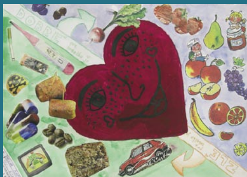
2. miesto – Helena Blažeková