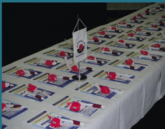
Wörwag Pharma GmbH & Co. KG.