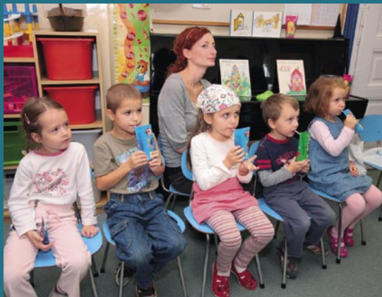
Slávnostný prípitok s džúsom.

„Som riaditeľka materskej školy, ktorá práve obdržala od Vás krásny darček – knihy pre deti „Srdiečko moje“. Váš darček nám doplní náš