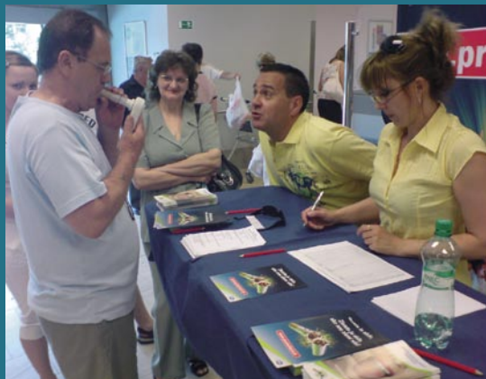
Pfizer Luxembourg SARL, o.z.

Ako ukázali výsledky meraní, počas skriningov bolo pri priemernom veku 41 rokov a pri prevahe mužov (66 %) nad ženami (34 %) s prevládajúcim stredoškolským vzdelaním (39 %) celkovo vyšetrených 157 respondentov, pričom najviac respondentov z tohto počtu bolo v skupine „ťažký fajčiar“ s priemerným percentom oxidu uhoľnatého v krvi 1,8 (pri rozpätí 0,0 % – 6,5 %) so slabou nikotínovou závislosťou. Respondenti fajčili priemerne 18 rokov, pričom najviac respondentov fajčilo 11 – 20 cigariet denne. Problémy s vysokým krvným tlakom uviedli zo 43 %