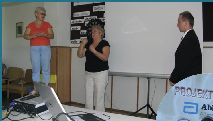
Interaktívne DVD PROJEKT MOST II. pre nepočujúcich.

Slávnostné odovzdanie interaktívnej príručky sa uskutočnilo 13. septembra 2008 v Nových Zámkoch v rámci celoslovenského stretnutia nepočujúcich, ktoré zorganizovalo občianske združenie CODA.