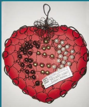
1. miesto – Zuzana Tóthová