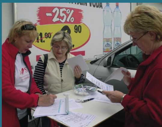
Preventívne vyšetrenia v rámci projektu firmy BayerHealthCare.