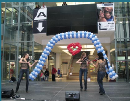
Husľové trio X-plosion.