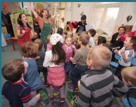
Gombík & Gombička.