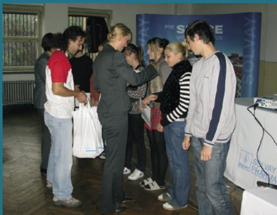
Ocenených 9 najlepších prác študentov.

www.tvojesrdce.sk MOST kód tvojho srdca: 0 - 30 - 5 - 120 - 80 MESIAC O SRDCOVÝCH TÉMACH