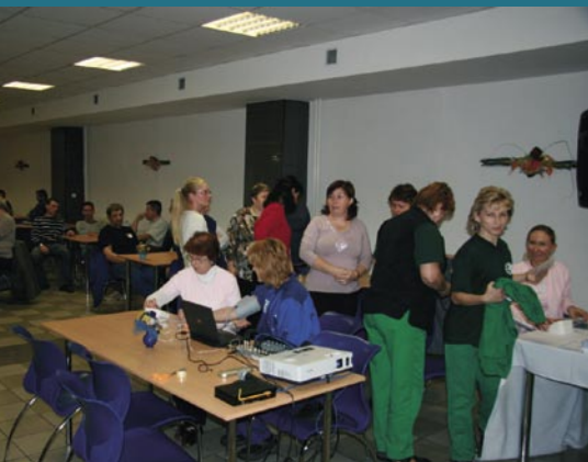
Zamestnanci podniku PSL, a.s. a závodu Sauer.